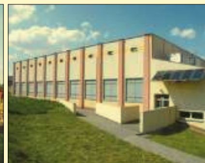
Solary na hali widowiskowo-sportowej w Gołczy