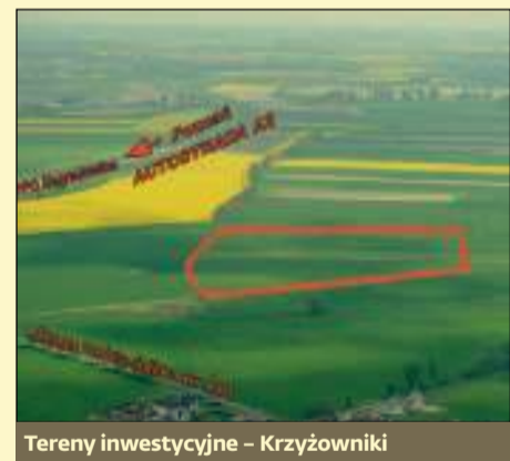
Tereny inwestycyjne – Krzyżowniki

Gmina Kleszczewo nie boi się innowacyjnych rozwiązań. Doskonałym przykładem jest zaproponowana przez wójta kanalizacja ciśnien-