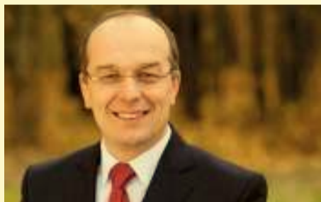
Burmistrz Dariusz Wróbel

Od wielu lat priorytetem gminy Opole Lubelskie jest inwestowanie w infrastrukturę techniczną oraz pozyskiwanie środków zewnętrznych. Dzięki temu w ciągu ostatnich 5 lat znacznie wzrosły dochody budżetu miasta.