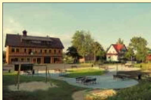
Centrum wsi Kamienica

To trzeba podkreślić! Inwestycje w gminie Gołcza idą w parze z sukcesami. Istniejąca zaledwie od 5 lat Akademia Piłkarska Gołcza z roku na rok dostarcza mieszkańcom gminy kolejnych powodów do radości – zarazem dowodów, że warto tu stawiać także na rozwój sportu. Nie da się ukryć, że bez posiadania nowoczesnych obiektów sportowych nie byłoby sukcesów młodych gołczan. W lipcu zeszłego roku drużyna trampkarzy, reprezentująca Akademię Piłkarską Gołcza, odniosła zwycięstwo w Ogólnopolskim Turnieju „Mała Piłkarska Kadra Czecha”, a miesiąc później wygrała zawody „Wakacje z Piłką Nożną 2015”.